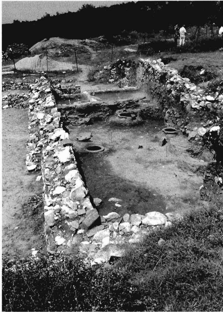
Arethousan varhaiskristillisen kirkon pohjoinen sivulaiva.