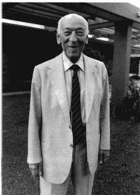
Pääkonsuli Constantin Lazarakis.